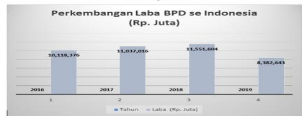
Gambar 1.4 Posisi Perkembangan Laba BPDSI 2016- Sept 2019